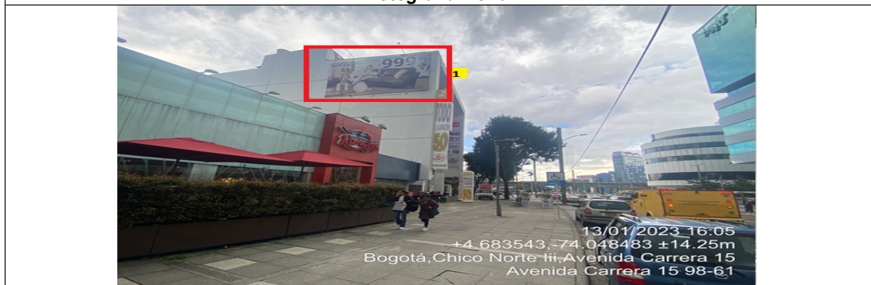
Fotografía No. 6

En la cual se evidencia un (1) elemento publicitario perteneciente al establecimiento comercial BRUNATI , propiedad de la sociedad RISUPILO S.A.S , el cual se encuentra ubicado en la culata de la edificación y es adicional al único elemento permitido por fachada de establecimiento comercial.